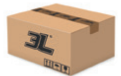
120 pares caja 120 pairs box