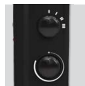
Termostato automático regulable y selector de potencia

Ambos modelos se pueden instalar en la pared.