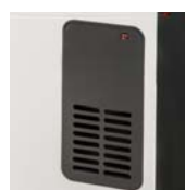
Salida de aire forzado TLS-503T