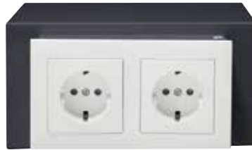
SUKO Ref. 23100W-S0