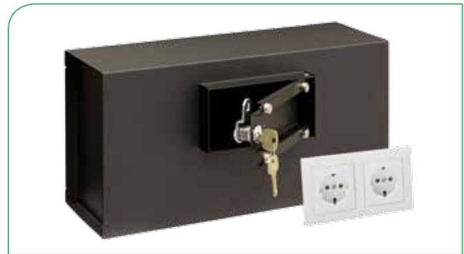
Dispone de capacidad para guardar pequeños objetos de valor.