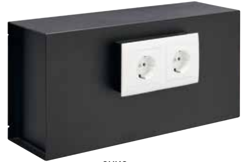
SUKO Ref. 23100W-S1