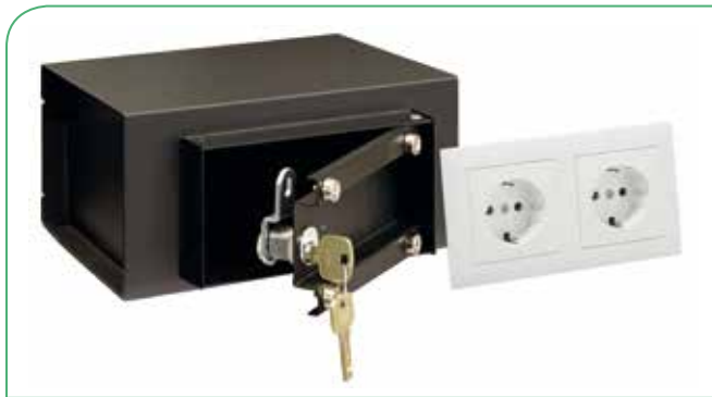
Retirando la placa de enchufes se accede a la cerradura de la caja